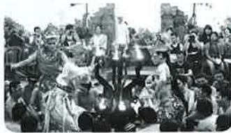
▲ケチャックダンス