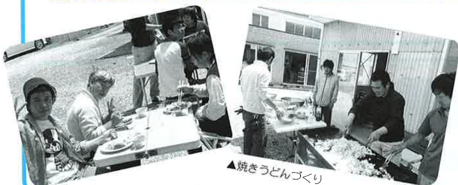
▲焼きうどんづくり

分達で作った料理はまた格別。あつという間に完食してしまいました。おいしい料理と楽しい時間で英気を養い、明日からまたお仕事頑張るぞ！