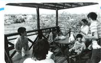
▲風がきもちいいー