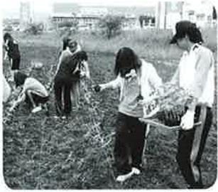
▲ひまわり畑定植しました

皆さんが「にじのかけはし」を見ている頃には、もしかしたらひまわり畑になっているかもしれません。是非近くに来た時は必ず「遠く」から見て綺麗に咲いているようならば、畑の中で記念撮影などいかがでしょうか。(失敗していたらすいません。) また来年は4000本の定植を考えています。(かなりハードです!)昭和女子大のみなさん、来年もまたお願いします!