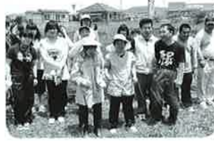
▲昭和女子大のみなさんと一緒に