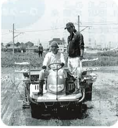
▲秋の実りを楽しみに

しかしねえ、この田んぼつてのは生き物が豊富でいいですね。特に水棲昆虫を多く見れるのがいい。アメンボ、ゲンゴロウ、ヤゴ。これって水が綺麗な証なんですよね。きたないところには、彼らは住もうとはしません。そんな綺麗な水でつくったお米をより多くの人に食べてもらうために、しっかりと管理していきますよ！