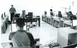
▲SLBB 国立聴覚障害者学校訪問