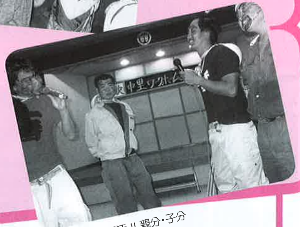
▲8年振りの復活!! 親分・子分