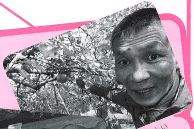
▲おいしいおいしいリンゴだよ〜♪