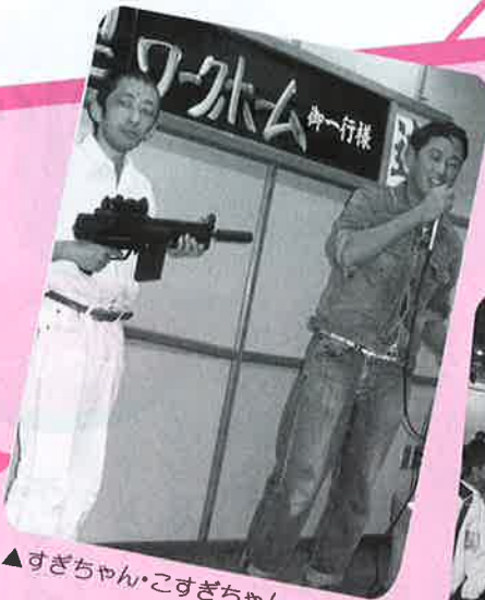
▲すぎちゃん・こすぎちゃん

最後になりましたが、旅行を無事に行うことができたのも、皆様のご理解とご協力を頂けたからだと思います。あじがっついでございました。