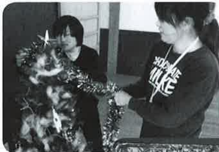
▲ツリーの飾り付け