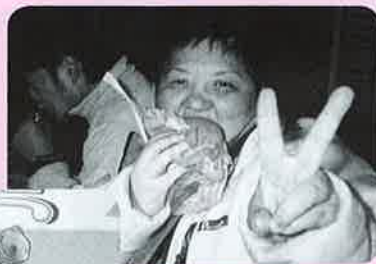
▲ハンバーガーおいしい♡