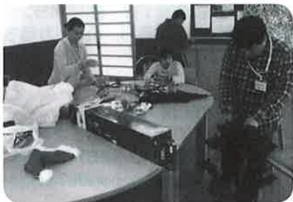
◀デコレーション中

8月に開所したばかりの生活介護事業所「桜の里」での活動を紹介します。日曜日から金曜日まで、平日は午前中はウォーキングを中心とした「体育活動」で、午後からはバッテリーキャップ組立てを中心とした「軽作業」とちぎり絵、パズル、お菓子作り等の「創作活動」を行っています。