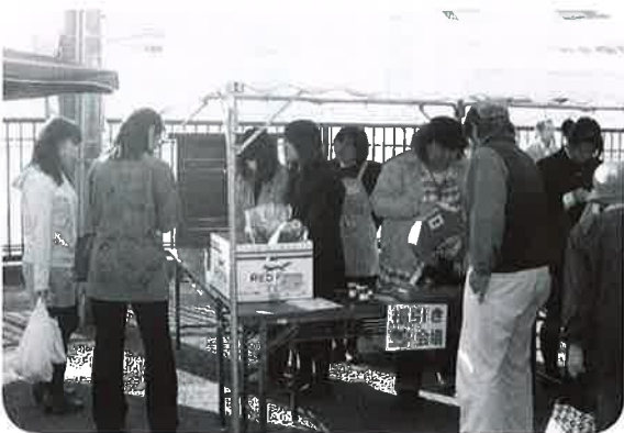
▲何が当たるだろう?

おかげさまで多くの方々にご来場いただき、秋の一日をみなさん楽しく過ごしていただけたことと思います。また来年も皆様にお会いできることを楽しみにしています。