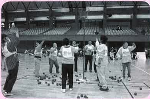
▲協力してがんばるぞ!!

11月17日に藤原運動公園にて安房地区障がい者スポーツ大会が開催されました。開会式は、聴覚障がいのある方でも分かる様にした手話通訳など配慮され、様々な障がいのある方が競技を通してスポーツを楽しめるように準備されています。私達は、中里の家とワークホームの利用者16名で