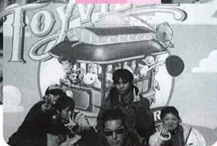
▲トイ・ストーリーマニアたのしかったね!