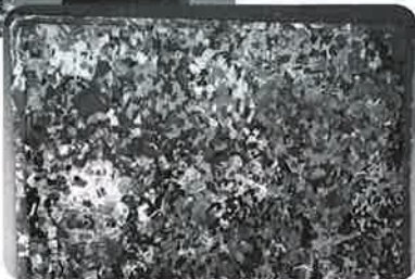
▲ちぎり絵で作った「サンタクロース」