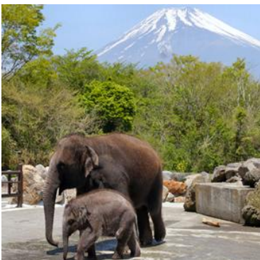
富士サファリパーク

今年の一泊旅行は9月26日～27日に山梨方面を予定しています。主な立ち寄り場所は、富士サファリパークと笛吹川フルーツ公園となっております。富士サファリパークはみなさん御存知の通り野生に近い動物園として知られています。笛吹川フルーツ公園は富士見百景や新日本三大夜景に認定されている公園で、植物の博物館や果物を使ったデザートを提供するカフェが充実しています。