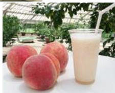
フルーツ公園のデザート