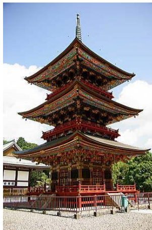
三重塔(重要文化財)